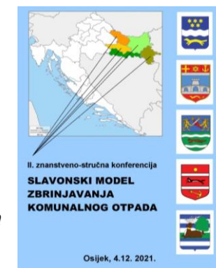
Naslovnica zbornika SLAMKO 2021.