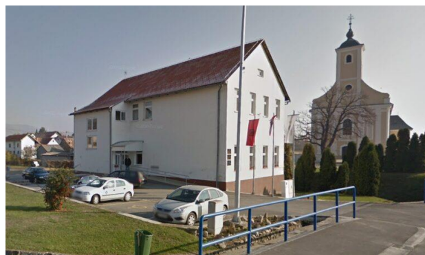
Zgrada općine Kaptol