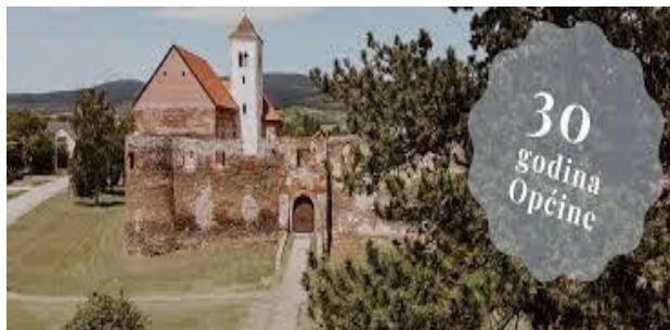
Dvorac – Stari grad