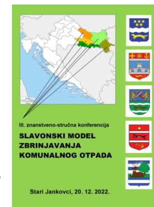
Naslovnica zbornika SLAMKO 2022.